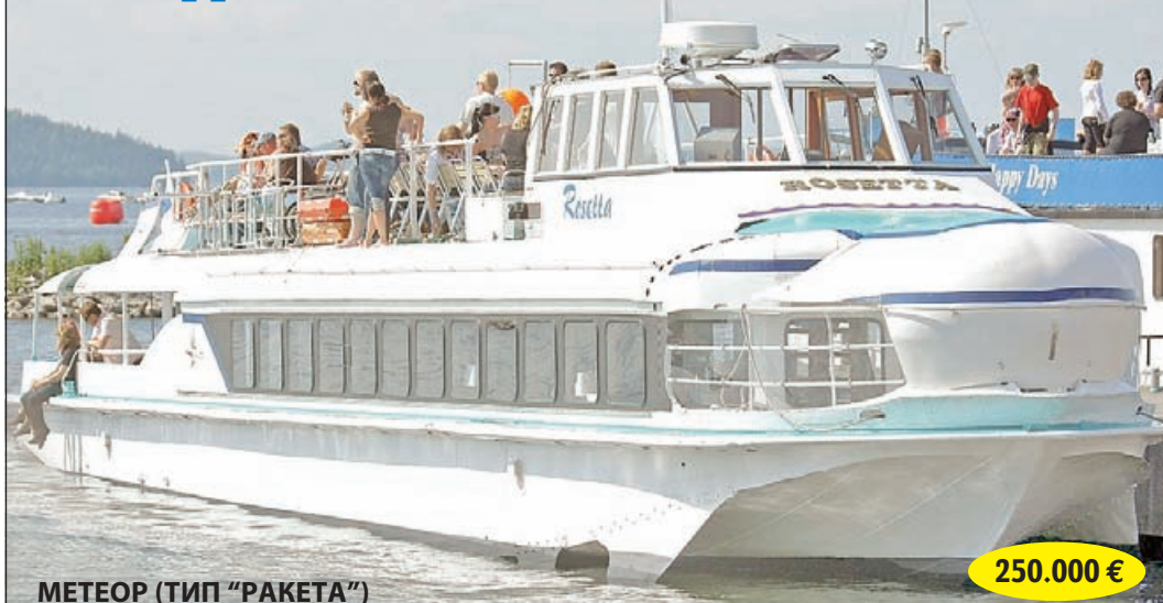
МЕТЕОР (ТИП "РАКЕТА")