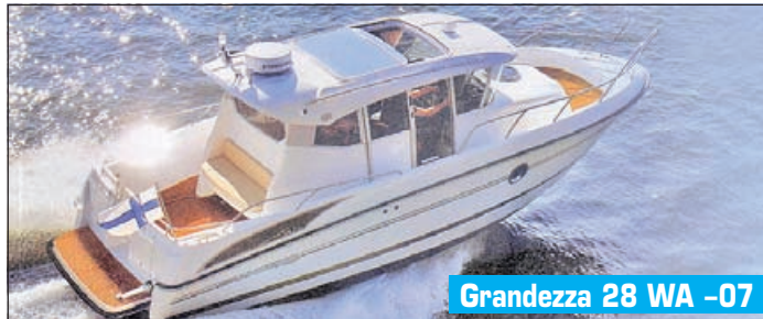
Grandeza 28 WA -07

VATOR OY JA TAMMER-VEINE OY KONKURSSIHALLINNOT