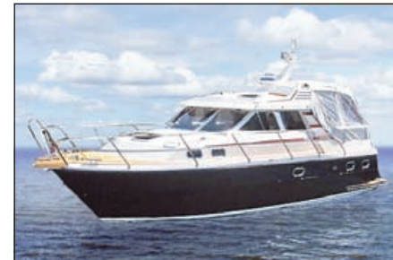
Nord West 330 Classic

13,7 x 3,6 м, -89, мачта 16,8 м, 11 500 кг, Perkins dsl 78 кг, 10 спальных мест, сауна, радар, gps и др.165.000€ Johan Johnson, Parainen. +358 400 688 173, jjohnson@schildts.fi www.nettivenne.com ID: 362742