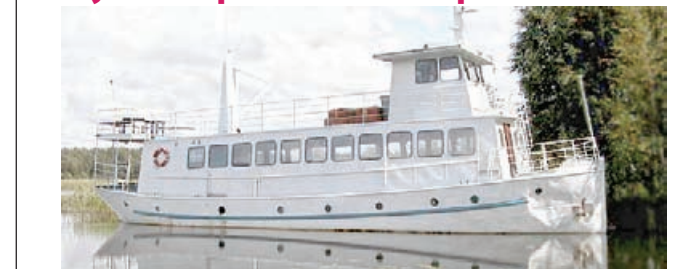
Площадь озера Пяйянне 1.080 км². Дл. озера 119 км, ширина 30 км.