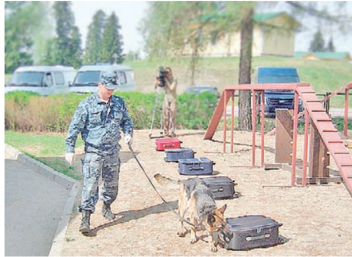
Демонстрация работы специальных собак на учебно-тренировочной базе в Вяртсиля.

— На всю таможенную службу Финляндии только одна собака, обученная на поиск табачных изделий?