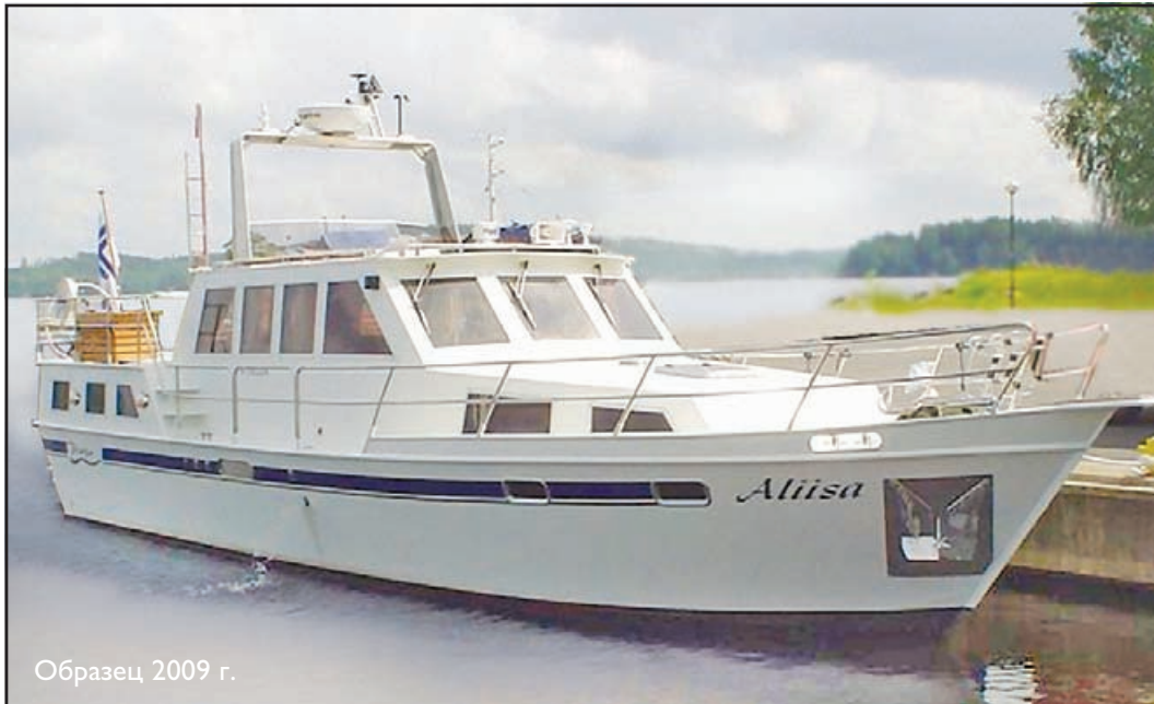
Образец 2009 г.