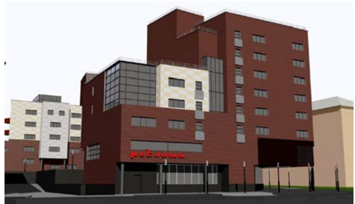
Проект нового офисного здания

Возводить такие подражательные одинаковости (типа ЦУМа и т.д.) у нас до сих пор считается «современным». Поделюсь еще одной путевой заметкой — о путешествии в столицу соседнего региона, Архангельск. Центральный проспект там по расположению похож на наш — начинается от вокзала и упирается в набережную. Но он печально удивил меня тем, что практически весь застроен типовыми советскими многоэтажками 1970-80 годов, которые тогда тоже считались «современными». Хотя никаких военных разрушений в этом городе не было. Тем не менее, старинные поморские деревянные здания там либо снесены, либо перенесены в один из переулков. И там невольно охватывает гордость за свой родной город, где центральный проспект все же сохраняет свою уникальность, несмотря на