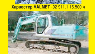
КОБЕЛКО -01 SK 210 LC 8.900 ч 33.500 € oy Finn-Machines +358-500-929 908 www.finnmachines.fi