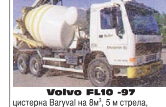
Volvo FL10 -97 цистерна Baryval на 8м³, 5 м стрела, центр. смазка, конд. Цена 27.000 € и др. бетоновозы +358 44 2900 046