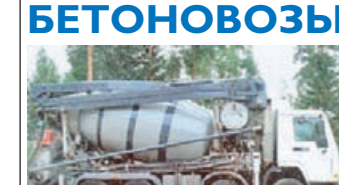
БЕТОНОВОЗЫ CIFA MAGNUM S 6 стрела 24 м, цистерна 10 м³, -97 Экспл. насоса 2900 ч. Машина Volvo FL 12, пробег 260 ткм. Техосмотр. Хор. состояние. Цена 45.000 € тел. +358-400-472 331