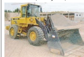
VOLVO L 90C -98 крепеж, ковш тел. +358 40 596 8295