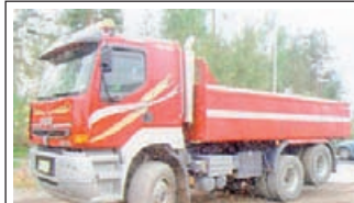
SISU E11 370 -05 пробег 106 000 км Грузоподъемность 15.05 т Цена 85.000 € тел. +358 400 228 862