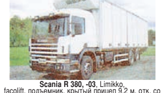
Scania R380 -03, Limikko, facolift, подъемник, крытый прицеп 9,2 м, отк. со всех сторон тел. +358 400 277 325