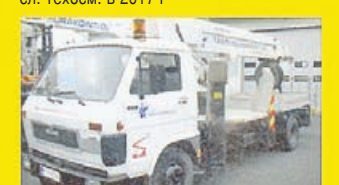
MAN стрела BRONTO 25, -93 сл. техосм. в 2014 г