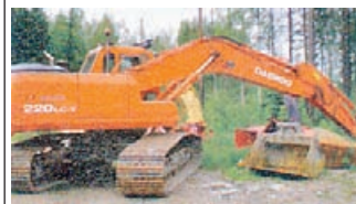
DAEWOO 220 -02 Цена: 28.700 € Т. +358 50 597 7785