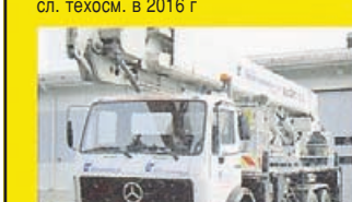
MERCEDES BENZ стрела BRONTO 33, -87 сл. техосм. в 2016 г