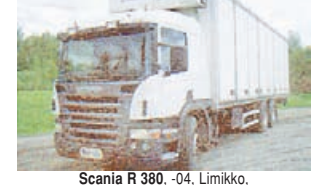
Scania R380 -04, Limikko, facolift, подъемник, крыт. приц. 9,2 м, отк. со всех сторон