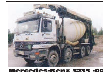
Mercedes-Benz 3235 -00 230 ткм, THEAM, телескопич. руков, цистерна Stetter на 9 м³. Цена 52.000 €