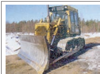
CAT D6D -82 в очень хорошем состоянии, новые цепи и гусеницы

Двигатель работает с шестиступенчатой автоматической трансмиссией и полноприводной системой xDrive AWD. Пакет также включает высокопроизводительную выхлопную систему, гоночные каталитические конвертеры, глушитель, а также дополнительную систему воздушного охлаждения.