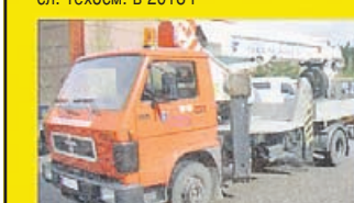
MAN стрела BRONTO 25, -93 сл. техосм. в 2016 г