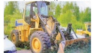
КОБЕЛКО LK500 -84 в хорошем состоянии. 13.000€ +358 400 680 670, +358 400 430 910