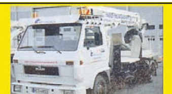
MAN -92 стрела BRONTO 25, -98 сл. Техосм. в 2017 г