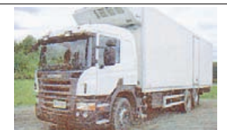
Scania R380 -07, Limikko 50, facolift, подъемник, крытый прицеп 9,2 м.