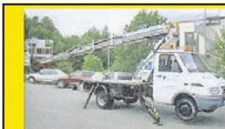
IVECO стрела BRONTO SKYLITE 19, -98 сл. техосм. в 2018 г