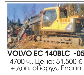
VOLVO EC 140BLC -05 4700 ч., Цена: 51.500 € + доп. оборуд., Encon Т. +358 400 704 341