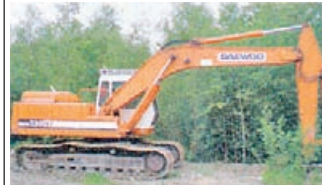
DAEWOO 220 -97 Цена: 16.400 €