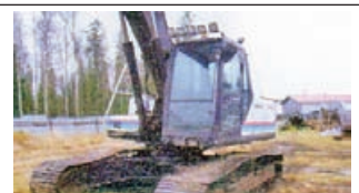
КОМАТСУ PC240LC -96 20 тыс. час., webasto, доп. гидравлика. 15.000€