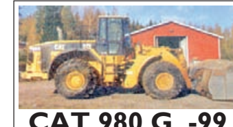
CAT 980 G -99 20 тыс. час., центр. смазка, износ колес 30% Цена: 75.000 € Truck'n Roll Oy Т. +358 400 625 396