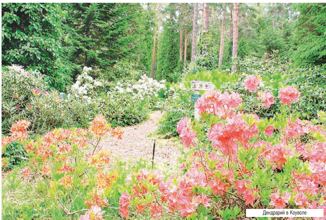
Дендрарий в Коуволле

Регион Кюменлааксо также известен широким спектром услуг для людей, любящих наслаждаться природой. Знаменитые кемпинги «Санталаhti», «Саарамаа», «Питкят хиеккат» ждут настоящих ценителей стильного отдыха.