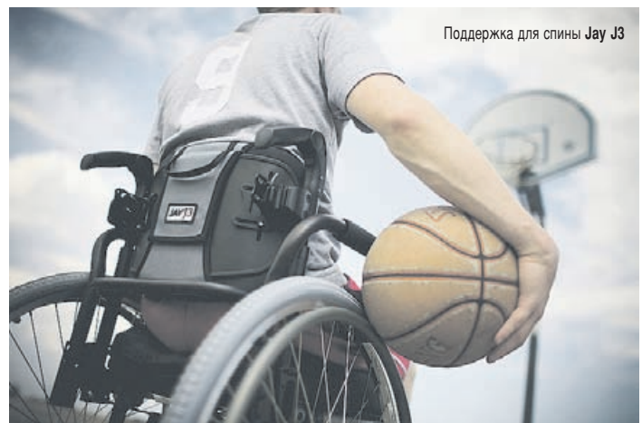
Поддержка для спины Jay J3

механизму крепления, поддержки J3 можно легко устанавливать, регулировать, а также отсоединять и присоединять за несколько секунд.