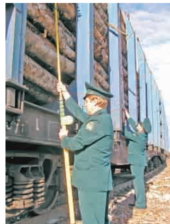
Контроль лесоматериалов на Медвежьегорском таможенном посту Петрозаводской таможни